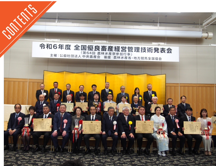
中畜が優良畜産経営管理技術発表会開催……P4

九州支局 〒812-0029 福岡市博多区古門戸町3-12 TEL092-271-7816 FAX092-291-2995