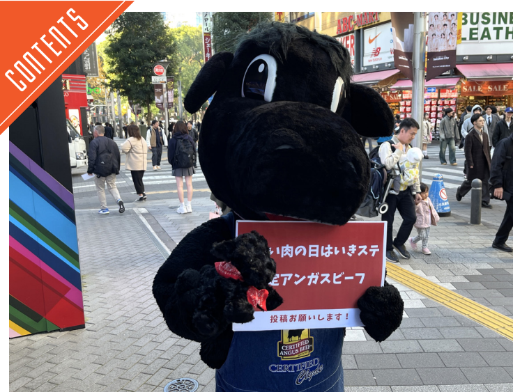
CAB協会、「いきなりステーキ」とコラボイベントを開催……P6

九州支局 〒812-0029 福岡市博多区古門戸町3-12 TEL092-271-7816 FAX092-291-2995