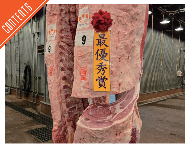
JA山口県牛枝肉共助会の最優秀賞牛ロース芯は114cm! ……P6

九州支局 〒812-0029 福岡市博多区古門戸町3-12 TEL092-271-7816 FAX092-291-2995