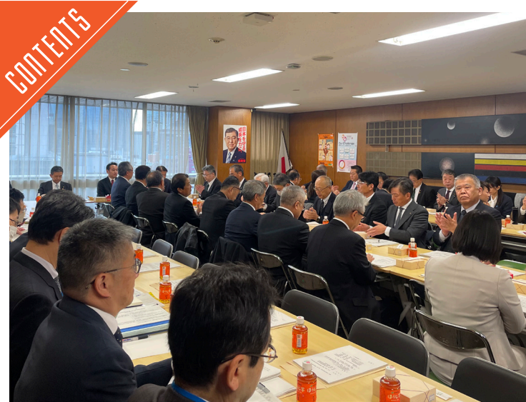
第1回畜産・酪農対策委が開催された……P4

九州支局 〒812-0029 福岡市博多区古門戸町3-12 TEL092-271-7816 FAX092-291-2995