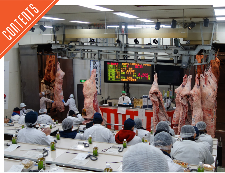
佐賀牛枝肉共励会が開催された……P5

九州支局 〒812-0029 福岡市博多区古門戸町3-12 TEL092-271-7816 FAX092-291-2995