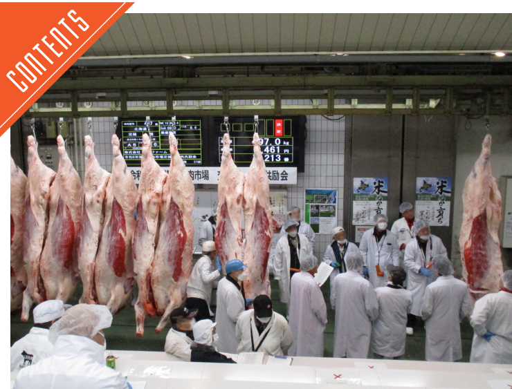
横浜市場が初の交雑種共励会を開催……P5

九州支局 〒812-0029 福岡市博多区古門戸町3-12 TEL092-271-7816 FAX092-291-2995