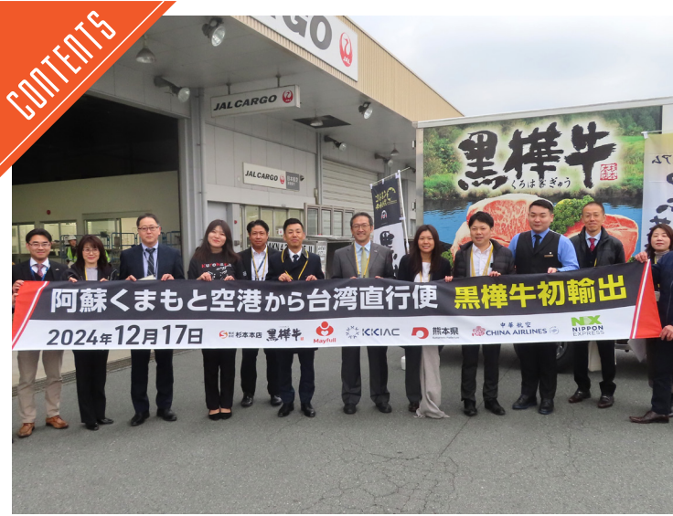
熊本空港から初輸出、杉本本店「黒樺牛」が台湾へ……P6

九州支局 〒812-0029 福岡市博多区古門戸町3-12 TEL092-271-7816 FAX092-291-2995