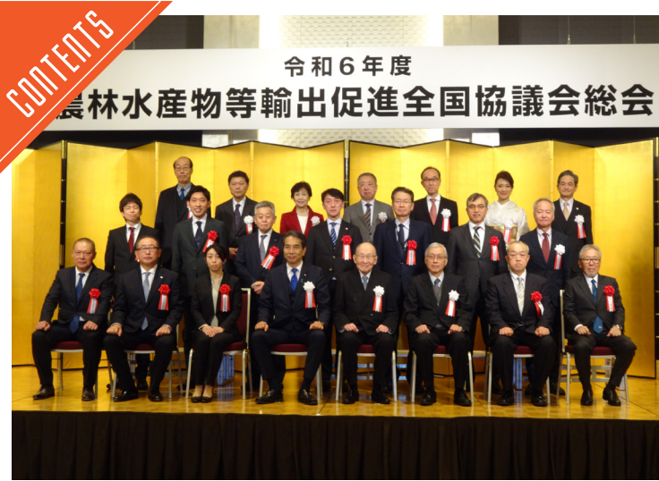
農林水産物等輸出促進協で表彰が行われた……P4～5

九州支局 〒812-0029 福岡市博多区古門戸町3-12 TEL092-271-7816 FAX092-291-2995