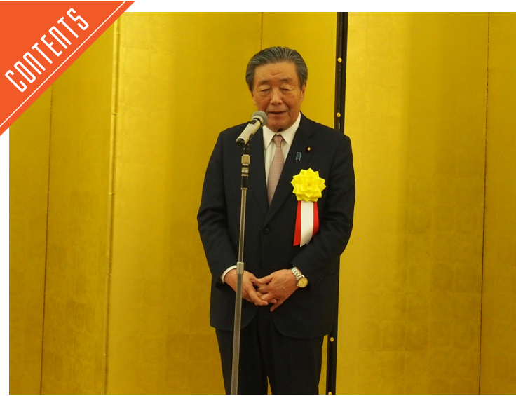
中央畜産会が新年賀詞交歓会を開催……P5

九州支局 〒812-0029 福岡市博多区古門戸町3-12 TEL092-271-7816 FAX092-291-2995