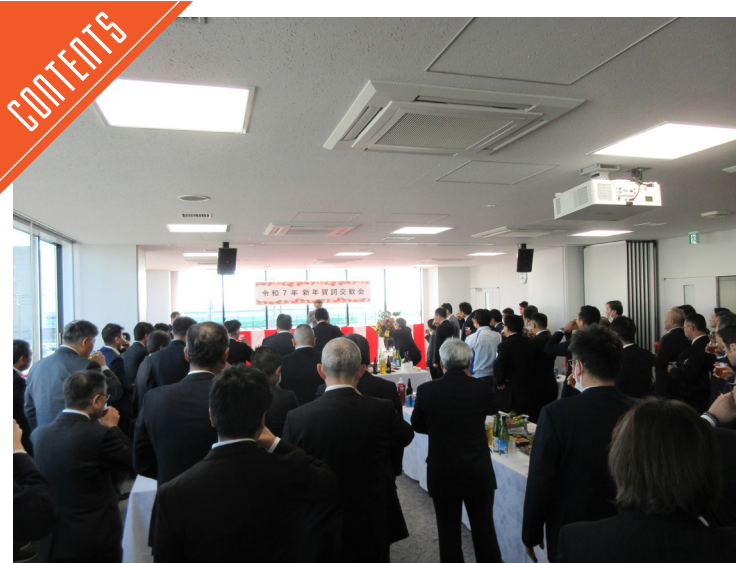
日本食肉流通センター3団体が新年賀詞交換会を開催……P4

九州支局 〒812-0029 福岡市博多区古門戸町3-12 TEL092-271-7816 FAX092-291-2995