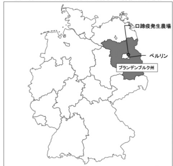
図 1月10日に口蹄疫の発生が確認された農場の所在地

ドイツでの口蹄疫発生を受けて、輸入側でも早急な対応が取られている。わが国では、11日付でドイツ産偶蹄類由来製品等の輸入一時停止措置が講じられた。また、1月13日現在で、韓国、メキシコ、シンガポール、カナダ、アルゼンチンでもドイツ産畜産物の