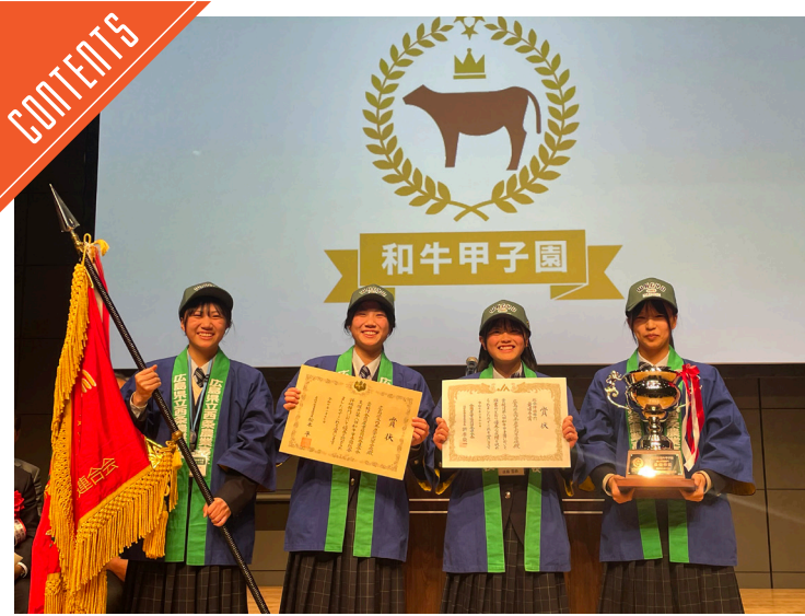
和牛甲子園閉幕、総合評価部門最優秀賞に広島県立西条農高……P2

九州支局 〒812-0029 福岡市博多区古門戸町3-12 TEL092-271-7816 FAX092-291-2995