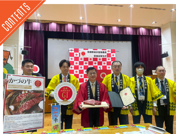
「かつの牛」が新たにGI登録……P3

九州支局 〒812-0029 福岡市博多区古門戸町3-12 TEL092-271-7816 FAX092-291-2995