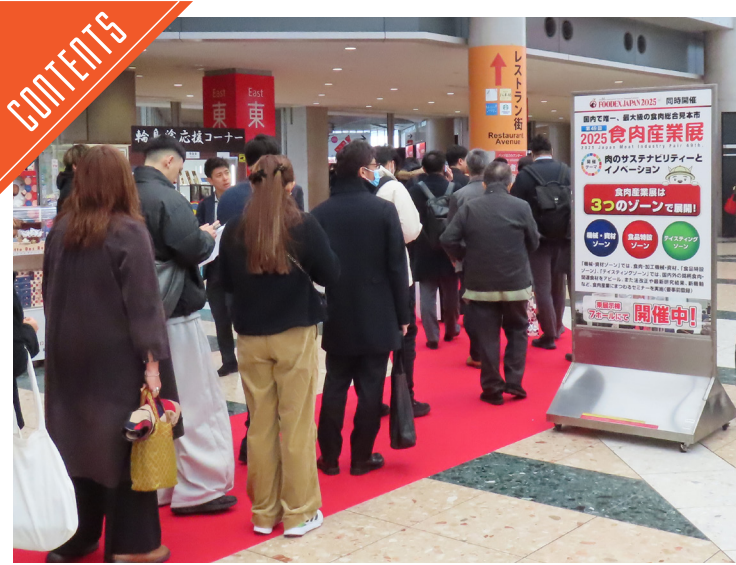
食肉産業展2025開催中……P2

九州支局 〒812-0029 福岡市博多区古門戸町3-12 TEL092-271-7816 FAX092-291-2995