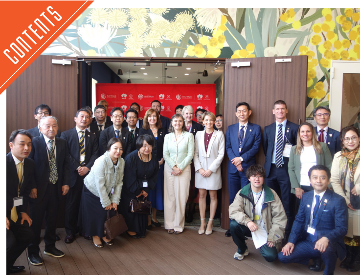
大阪・関西万博で南オーストラリア州政府が記念レセプションを開催……P3

九州支局 〒812-0029 福岡市博多区古門戸町3-12 TEL092-271-7816 FAX092-291-2995