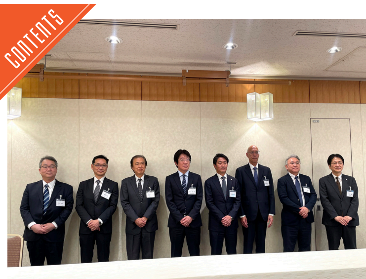
東京冷蔵倉庫協会が定時総会を開催……P6～7

九州支局 〒812-0029 福岡市博多区古門戸町3-12 TEL092-271-7816 FAX092-291-2995