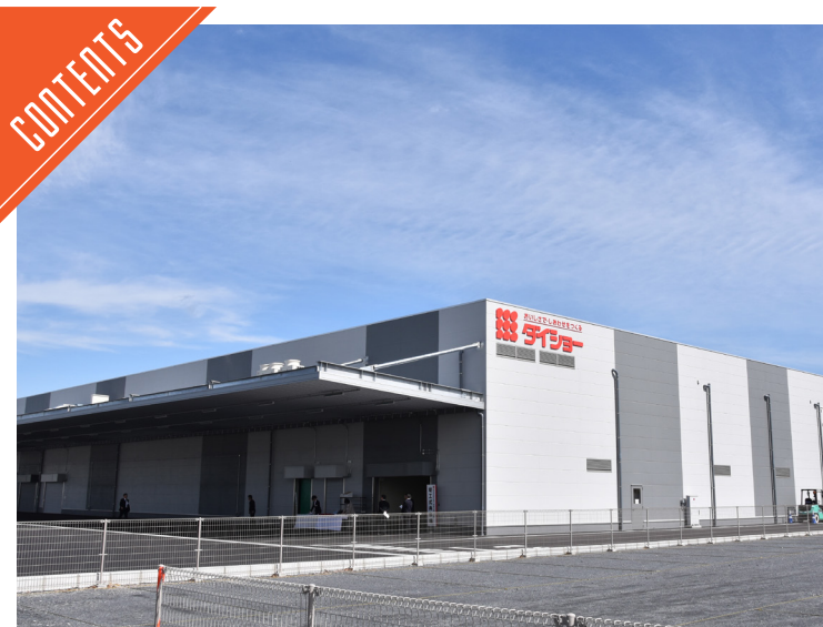
ダイショーが関東工場を増築した……P4

九州支局 ☎812-0029 福岡市博多区古門戸町3-12 TEL092-271-7816 FAX092-291-2995