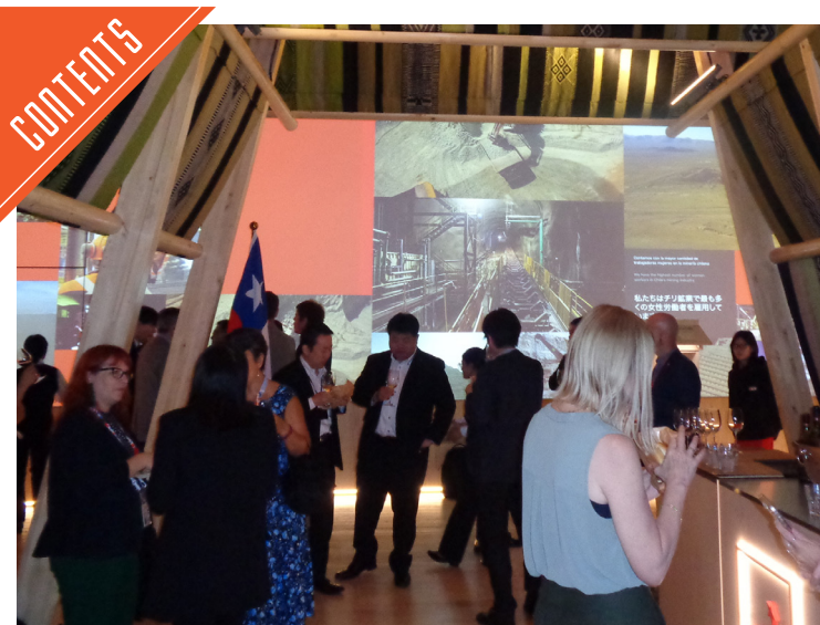
大阪万博でチリポークセミナーが開催された……P5

九州支局 〒812-0029 福岡市博多区古門戸町3-12 TEL092-271-7816 FAX092-291-2995