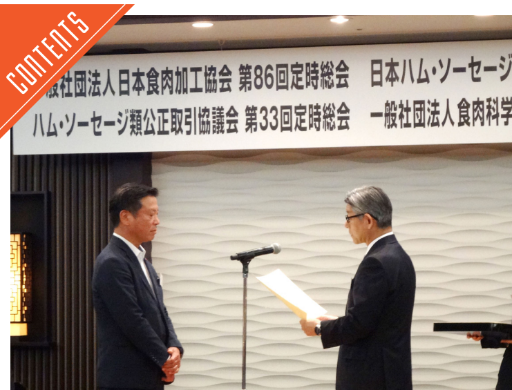
食肉加工4組合が総会を開催……P2～3

九州支局 〒812-0029 福岡市博多区古門戸町3-12 TEL092-271-7816 FAX092-291-2995