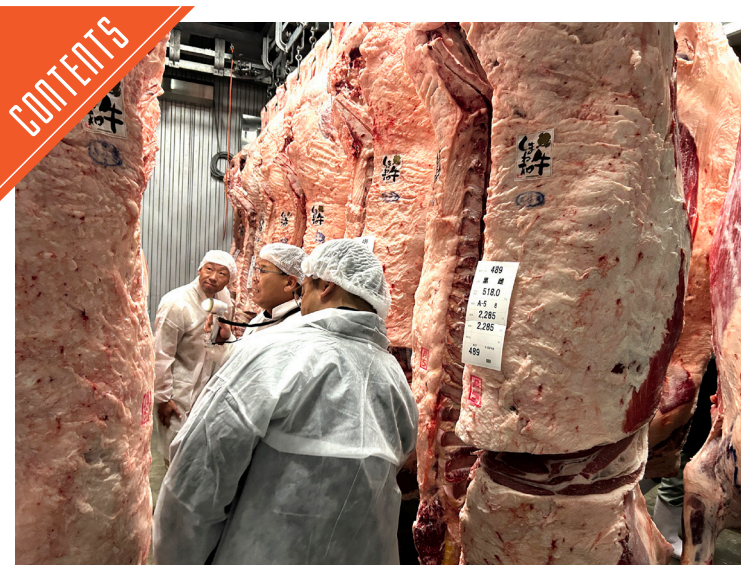
全肉連・島根肉連主催の神戸枝肉販売会を開催……P8

九州支局 〒812-0029 福岡市博多区古門戸町3-12 TEL092-271-7816 FAX092-291-2995