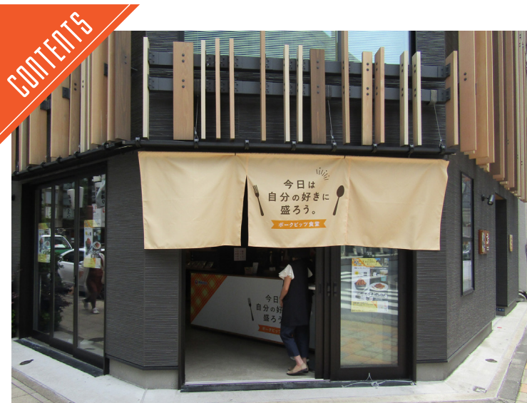
伊藤ハムが「ポークピッツ」のポップアップイベントを開催……P3

九州支局 〒812-0029 福岡市博多区古門戸町3-12 TEL092-271-7816 FAX092-291-2995