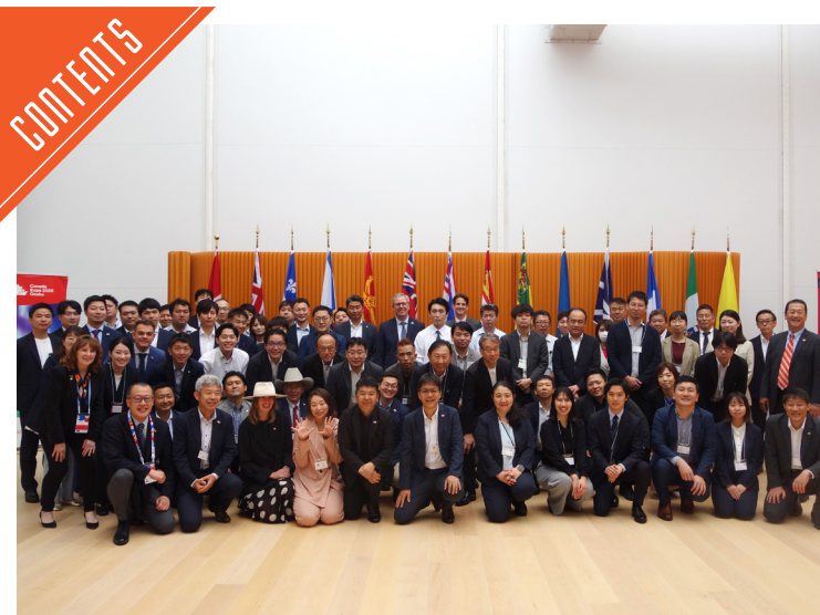
カナダビーフ国際機構が関西万博のカナダパビリオンでセミナー開催……P4

九州支局 〒812-0029 福岡市博多区古門戸町3-1-2 TEL092-271-7816 FAX092-291-2995