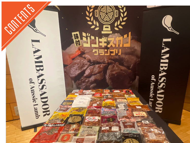
「味付ジンギスカンGP2025」が開催された……P3

九州支局 ☎812-0029 福岡市博多区古門戸町3-12 TEL092-271-7816 FAX092-291-2995