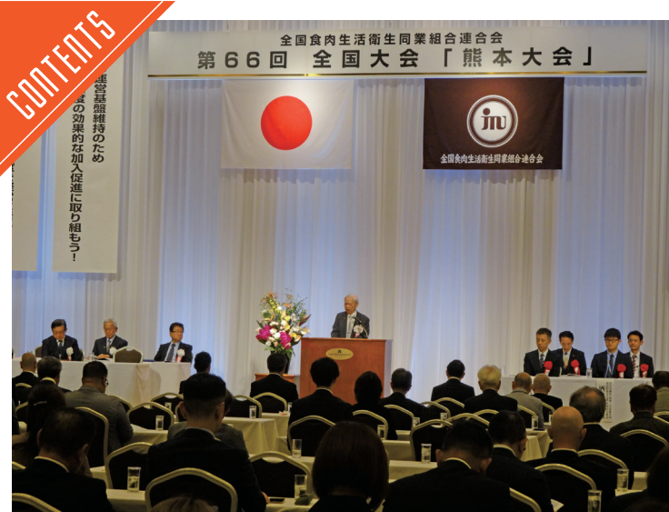
全肉生連全国大会が熊本で開催された……P2

九州支局 〒812-0029 福岡市博多区古門戸町3-12 TEL092-271-7816 FAX092-291-2995