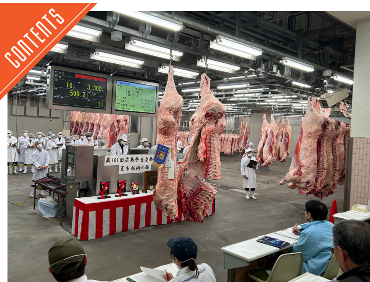
広島県畜産共進会夏季「枝肉の部」が開催された……P4

九州支局 〒812-0029 福岡市博多区古門戸町3-12 TEL092-271-7816 FAX092-291-2995