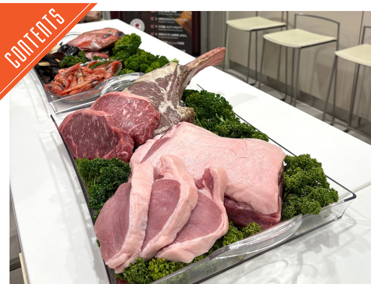
「第33回世界親と子のクッキング大賞」の決勝大会開催……P8

九州支局 〒812-0029 福岡市博多区古門戸町3-12 TEL092-271-7816 FAX092-291-2995