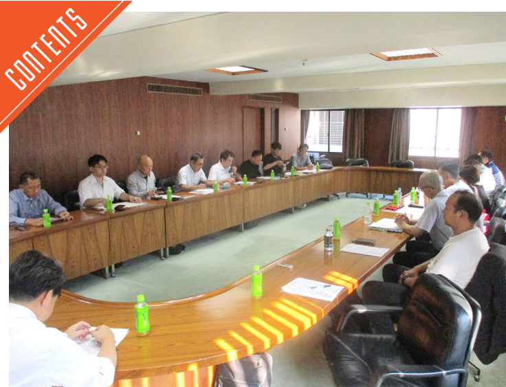
日本食肉協会、令和7年度第1回戦略検討会議を実施……P3

九州支局 〒812-0029 福岡市博多区古門戸町3-12 TEL092-271-7816 FAX092-291-2995