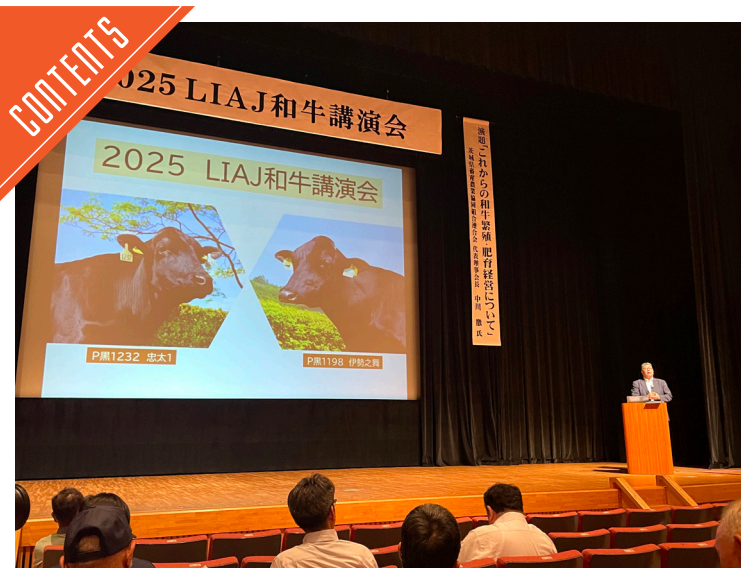
家畜改良事業団盛岡種雄牛センターが和牛講演会を岩手で開催……P2~3

九州支局 〒812-0029 福岡市博多区古門戸町3-12 TEL092-271-7816 FAX092-291-2995