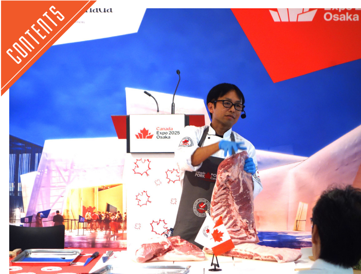
カナダポークが関西万博でカットデモンストレーション開催……P4~5

九州支局 〒812-0029 福岡市博多区古門戸町3-12 TEL092-271-7816 FAX092-291-2995