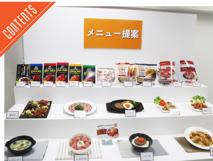
スターゼングループが2025年秋冬提案会を開催した……P3

九州支局 〒812-0029 福岡市博多区古門戸町3-12 TEL092-271-7816 FAX092-291-2995