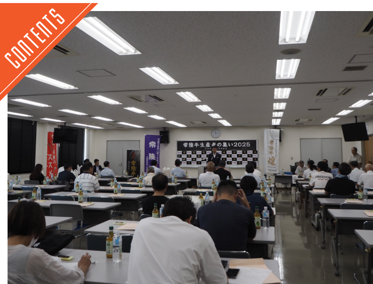
「常陸牛生産者の集い2025」が開催された……P4

九州支局 〒812-0029 福岡市博多区古門戸町3-12 TEL092-271-7816 FAX092-291-2995