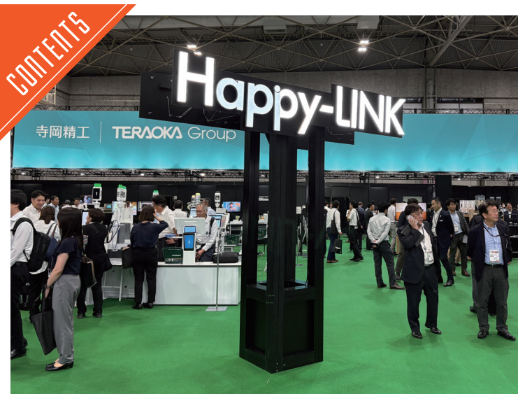
フードストアソリューションズフェア開催、寺岡精工など出展……P4

九州支局 〒812-0029 福岡市博多区古門戸町3-12 TEL092-271-7816 FAX092-291-2995