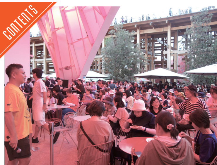
MLA、万博会場で一般来場者にオージー・ラム試食提供……P4

九州支局 〒812-0029 福岡市博多区古門戸町3-12 TEL092-271-7816 FAX092-291-2995