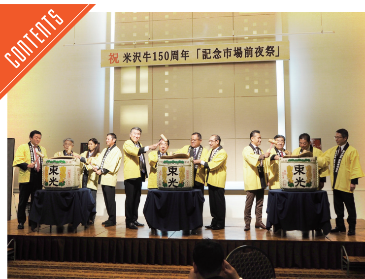
米沢牛150周年「記念セリ市場」が開催された……P3

九州支局 〒812-0029 福岡市博多区古門戸町3-12 TEL092-271-7816 FAX092-291-2995