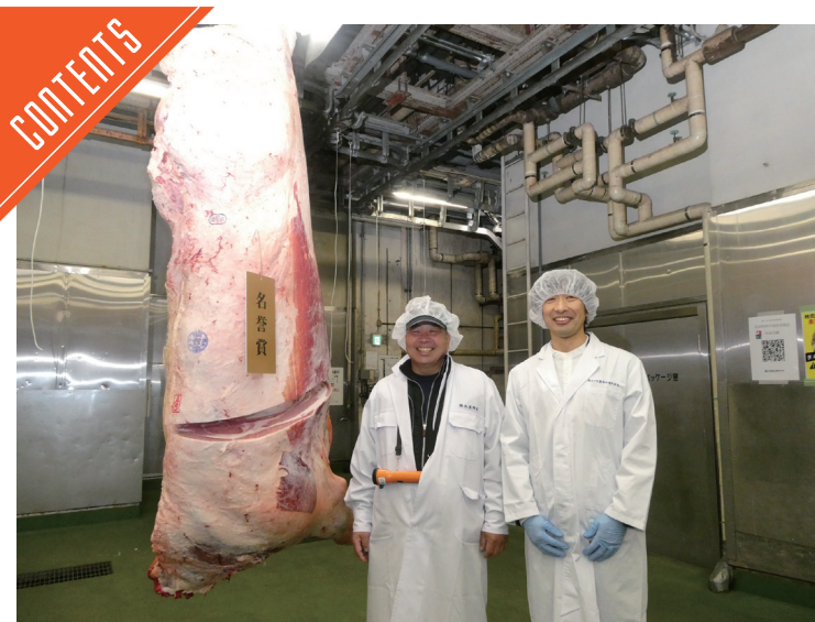
東京市場全共が開催された……P2

九州支局 〒812-0029 福岡市博多区古門戸町3-12 TEL092-271-7816 FAX092-291-2995