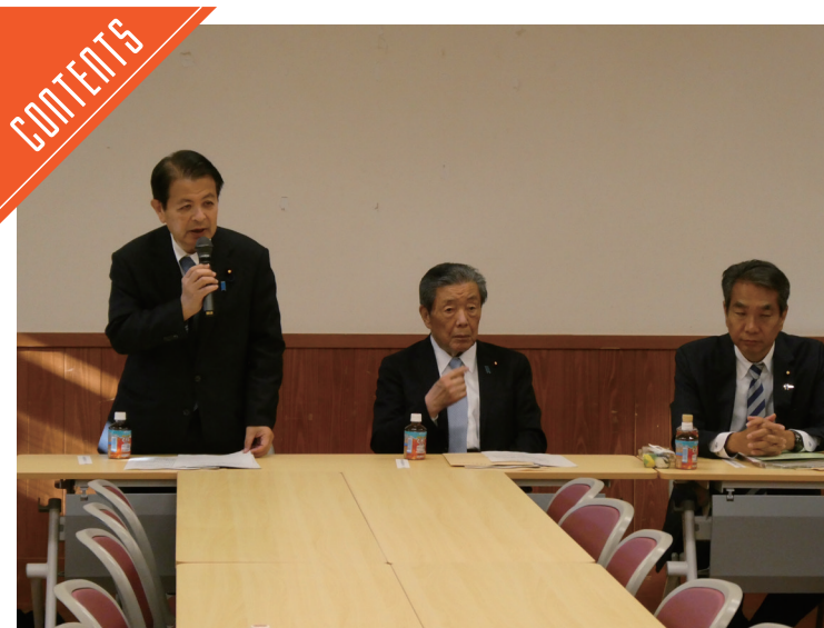
自民党、令和7年度補正予算重点事項案を議論……P2~3

九州支局 〒812-0029 福岡市博多区古門戸町3-12 TEL092-271-7816 FAX092-291-2995