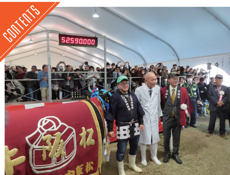
第74回松阪肉牛共進会が開催された……P3

九州支局 〒812-0029 福岡市博多区古門戸町3-12 TEL092-271-7816 FAX092-291-2995