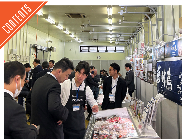
福留ハムが2025ミートフェスタを開催した……P4

九州支局 〒812-0029 福岡市博多区古門戸町3-12 TEL092-271-7816 FAX092-291-2995