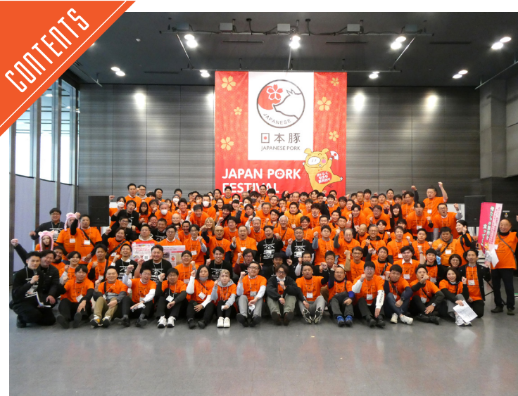
JPPA「俺豚」開催、豚しゃぶ無料提供など日本産豚肉の魅力アピール…P4

九州支局 〒812-0029 福岡市博多区古門戸町3-12 TEL092-271-7816 FAX092-291-2995