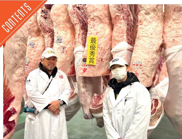
神戸市場で全農ミートフェアが開催された……P3

九州支局 〒812-0029 福岡市博多区古門戸町3-12 TEL092-271-7816 FAX092-291-2995