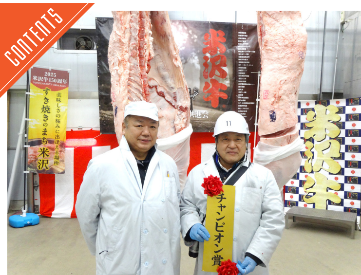
米沢牛枝肉共進会が開催された……P4

九州支局 〒812-0029 福岡市博多区古門戸町3-12 TEL092-271-7816 FAX092-291-2995