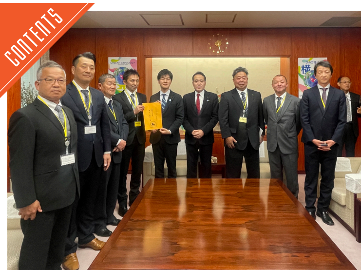
「とちぎの和牛を考える会」が農相に要望書を提出……P6

九州支局 〒812-0029 福岡市博多区古門戸町3-12 TEL092-271-7816 FAX092-291-2995