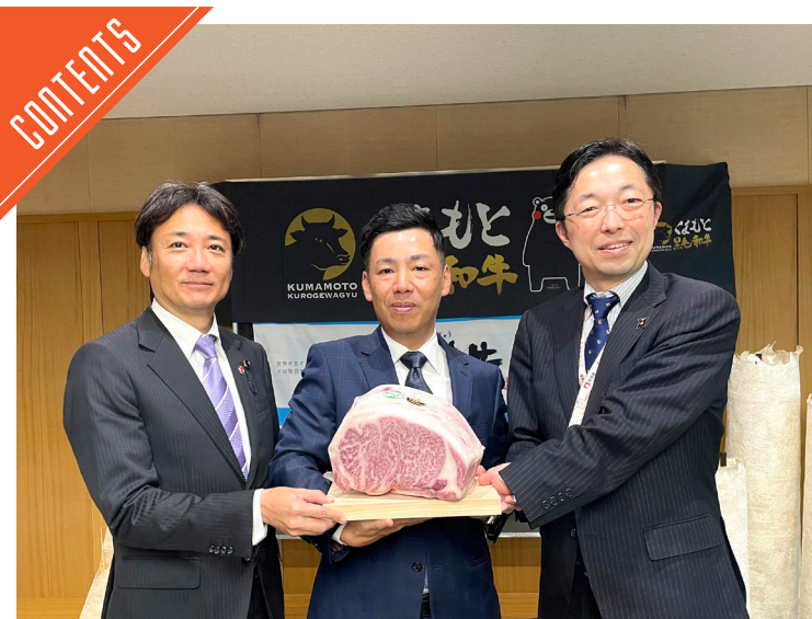
杉本本店がクウェート輸出を記念し木村知事を表敬……P7

九州支局 〒812-0029 福岡市博多区古門戸町3-12 TEL092-271-7816 FAX092-291-2995