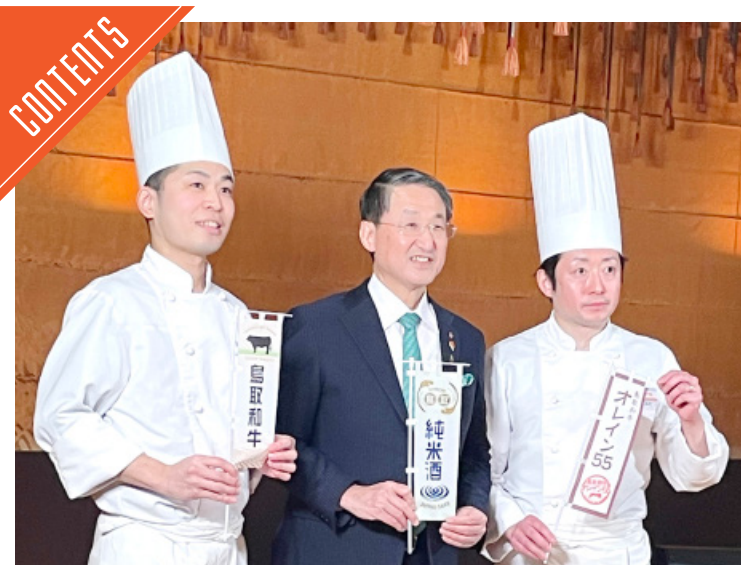
鳥取和牛フェアに先立ち、メディア発表会を都内で開催……P2~3

九州支局 〒812-0029 福岡市博多区古門戸町3-12 TEL092-271-7816 FAX092-291-2995