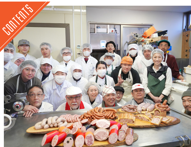
全肉連が令和7年度加工研修会を開催……P2～3

九州支局 〒812-0029 福岡市博多区古門戸町3-12 TEL092-271-7816 FAX092-291-2995