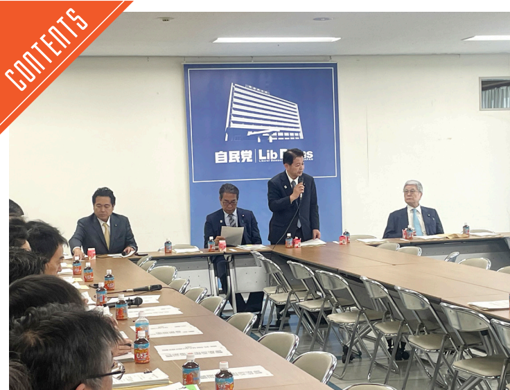
家畜伝染病予防法の一部を改正する法律案を議……P3

九州支局 〒812-0029 福岡市博多区古門戸町3-1-2 TEL092-271-7816 FAX092-291-2995