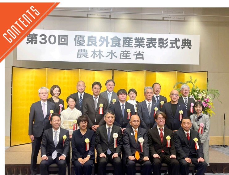
農水省が第30回優良外食産業表彰式典を開催……P6

九州支局 ☎812-0029 福岡市博多区古門戸町3-12 TEL092-271-7816 FAX092-291-2995