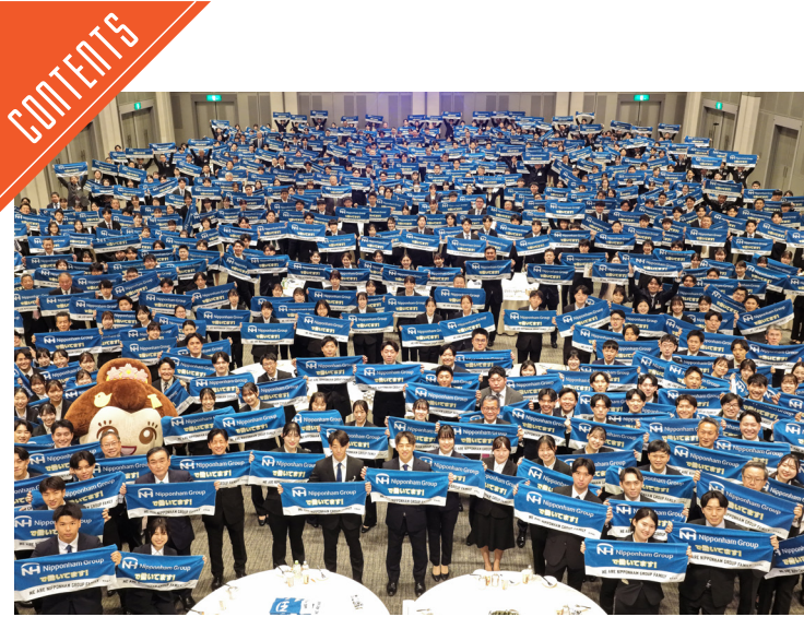
ニッポンハムグループ入社式が開催された……P4～5

九州支局 〒812-0029 福岡市博多区古門戸町3-12 TEL092-271-7816 FAX092-291-2995