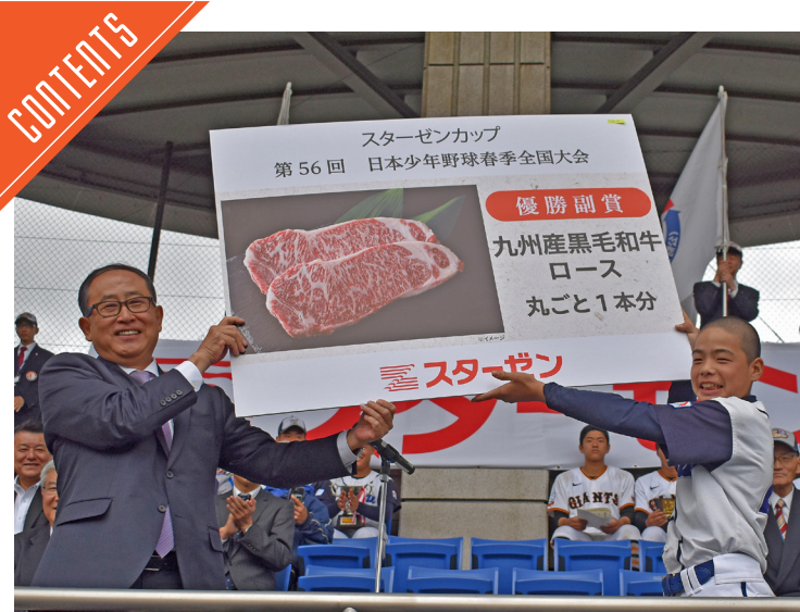
スターゼンカップ閉幕、優勝チームには和牛が贈られた……P4

九州支局 ☎812-0029 福岡市博多区古門戸町3-12 TEL092-271-7816 FAX092-291-2995