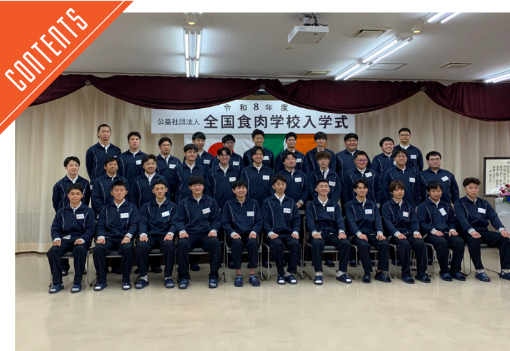
食肉学校入学式が開催された……P6

九州支局 〒812-0029 福岡市博多区古門戸町3-12 TEL092-271-7816 FAX092-291-2995