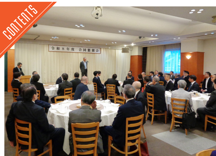
兵庫県食肉事業協同組合連合会は、令和8年度通常総会を開催した……P4

九州支局 〒812-0029 福岡市博多区古門戸町3-12 TEL092-271-7816 FAX092-291-2995